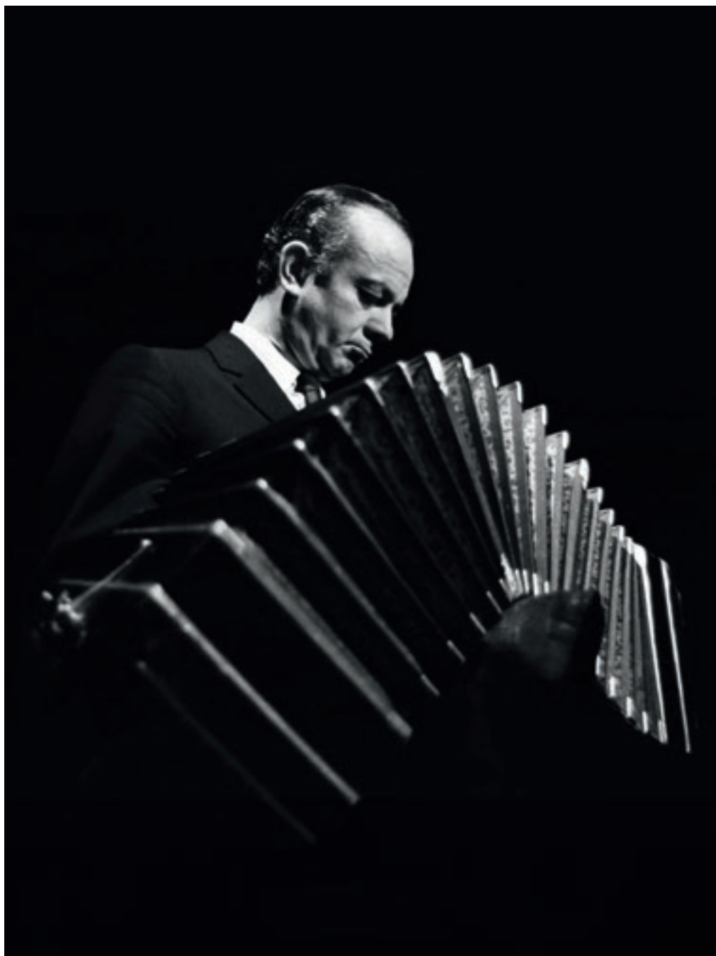
Astor Piazzolla, 1968