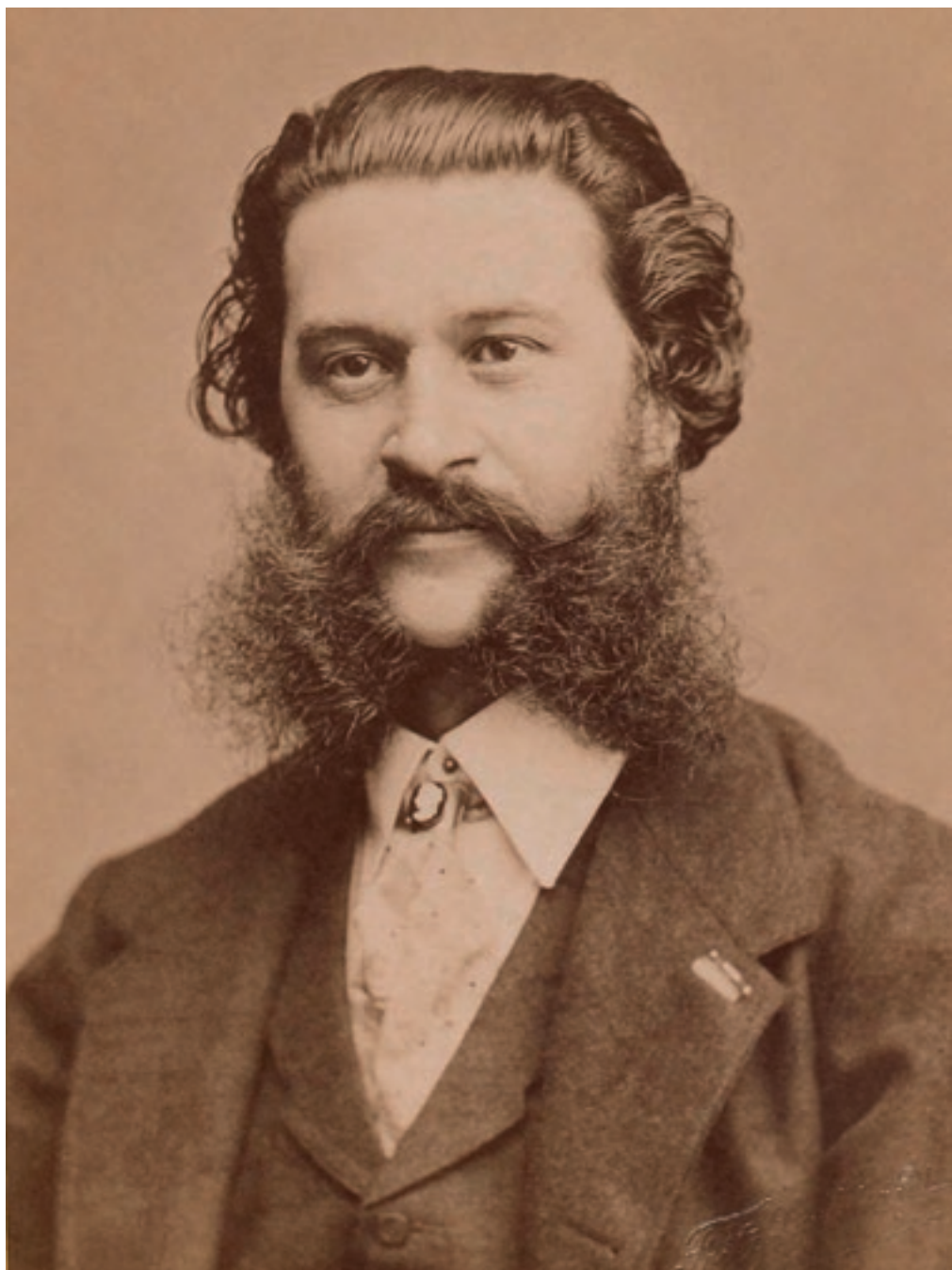
Fritz Luckhardt, Porträt von Johann Strauß