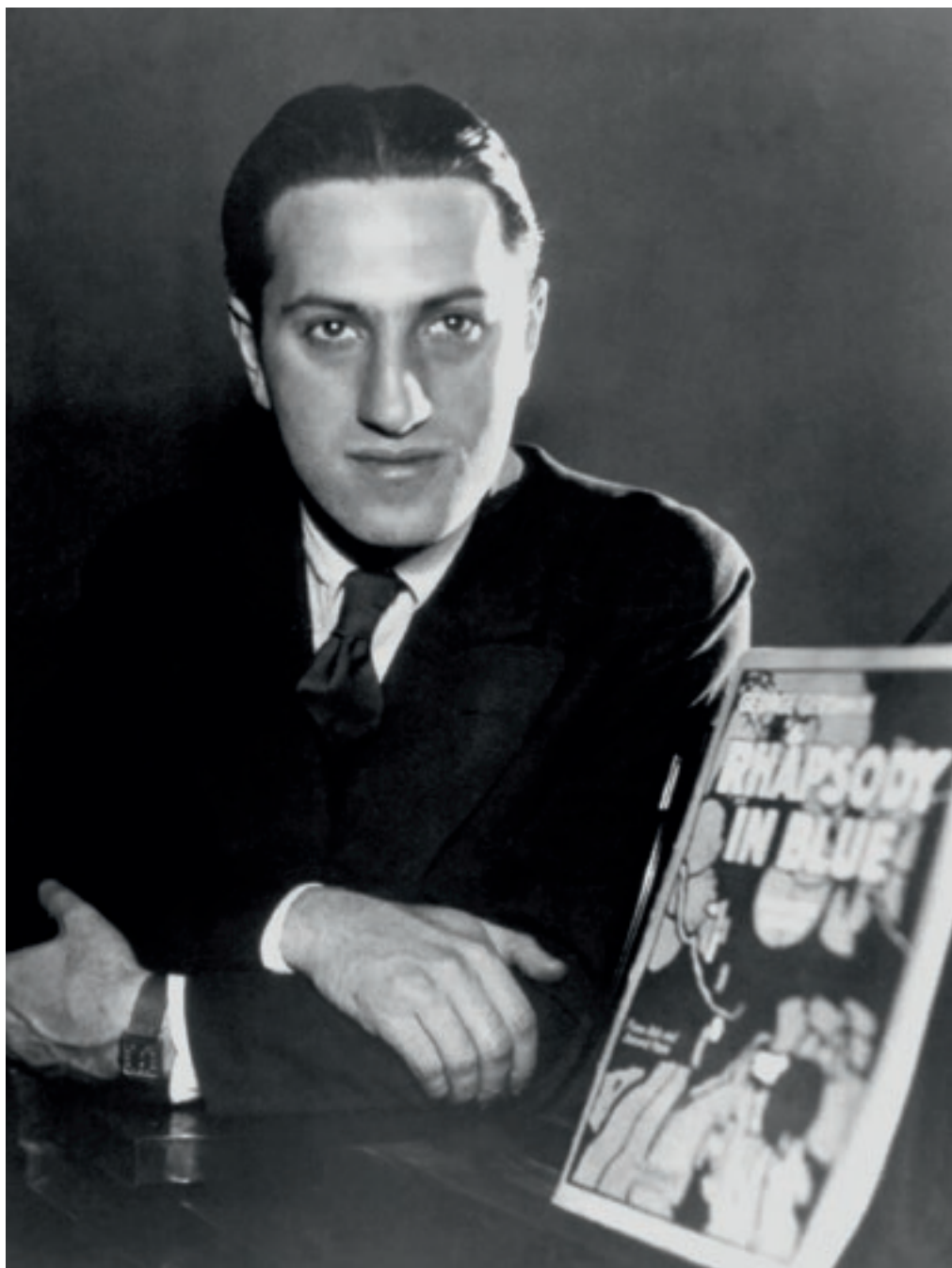
George Gershwin mit einer Notenausgabe der »Rhapsody in Blue«